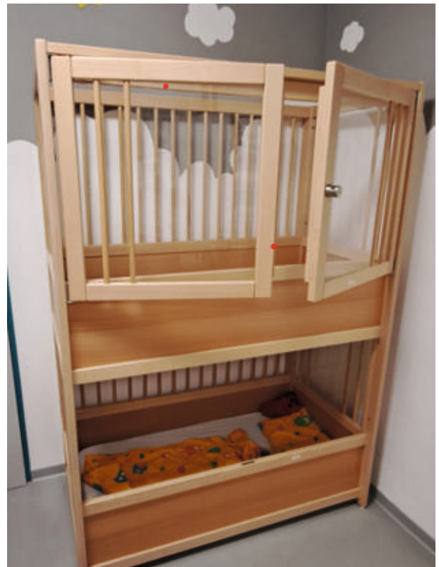
Etagengitterbett - 126 x 82 x 174 cm (L x B x H)

Interessenten geben bitte bis Donnerstag, 22.08.2024 schriftlich im verschlossenen Umschlag ein Gebot bei der Gemeindeverwaltung, Rathausstr. 7, 91617 Oberdachstetten ab.