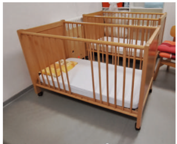
Gitterbett - 128 x 68 cm (L x B)