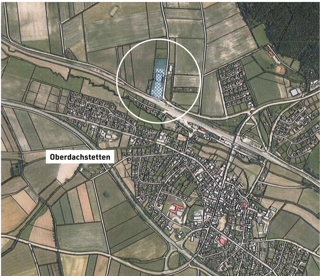
Lageplan Westheimer Straße 3 – Maßstab ca. 1:10000