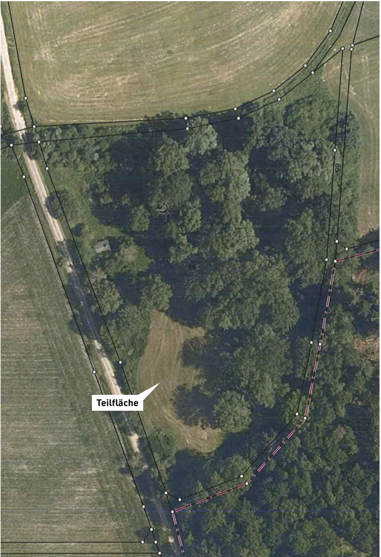
Lageplan Flurnummer 98 Gemarkung Mitteldachstetten - Maßstab ca. 1:1000