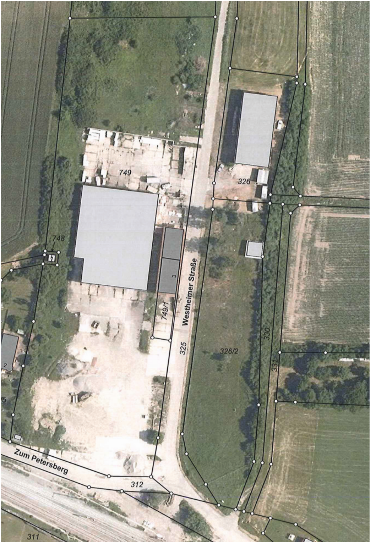
Lageplan Westheimer Straße 3 - Maßstab ca. 1:1000