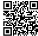
Actionbound NorA Anleitung

Diesen findet Ihr bereits heute in der App.