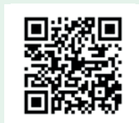
Actionbound NorA Anleitung

Mit Hilfe der App Actonbound schicken wir euch auf fünf individuelle GPS-gestützte Schnitzeljagden. Die Touren sind sowohl für Jung und Alt geeignet und sollen als Familie bzw. in Gruppen gelöst werden.