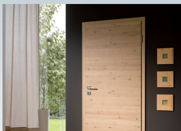
→ Innentüren Glas u. Holz